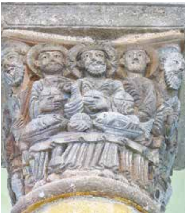
La multiplication des pains sur un chapiteau de l'église de Saint-Nectaire (Puy-de-Dôme).