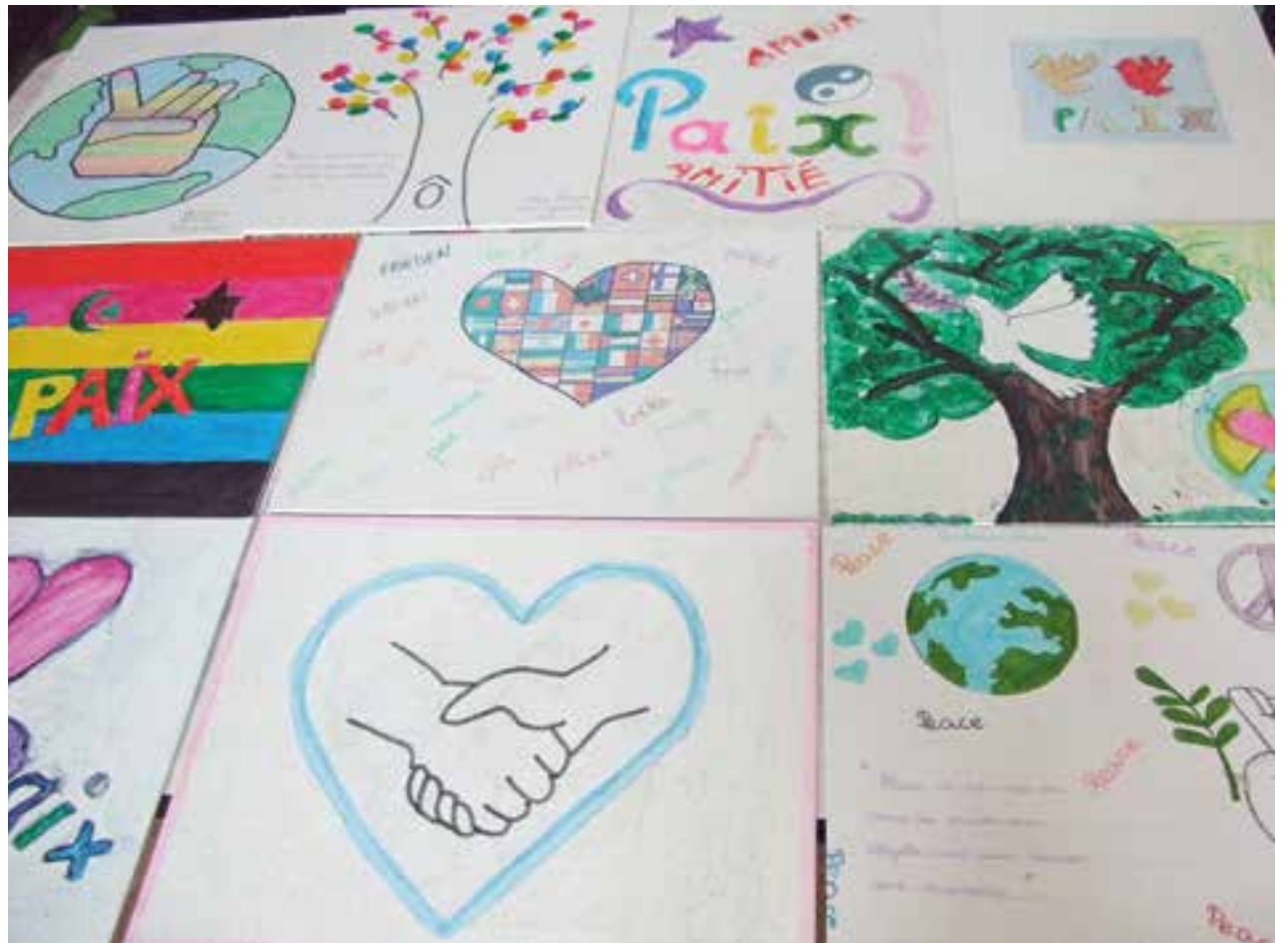
Les jeunes des aumôneries ont préparé des dessins sur le thème de la paix pour la rencontre internationale d'Arras le 21 avril prochain.